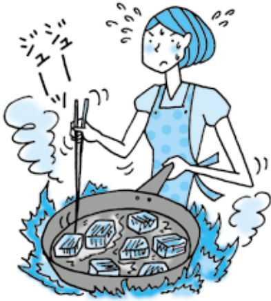
illustration: YURI Tanaka